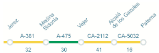
Ruta de los Castillos del Interior, distancia total: 119km