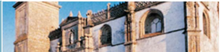
"Iglesia Santa María la Coronada" Medina Sidonia

En el centro de la comarca de La Janda, cuenta con una de las joyas más representativas del último gótico gaditano: la iglesia de Santa María la Coronada, con su riquísimo patrimonio artístico. En la arquitectura de este templo, situado en la parte más alta de la población, se empiezan a notar las nuevas influencias renacentistas. En Paterna de Rivera, también en La Janda, encontramos algunas interesantes muestras gótico- mudéjares en la parroquia de Nuestra Señora de la Hiniesta (siglo XVI) y en el cristianizado Castillo de Gigonza, de origen musulmán. Continuando por la misma zona geográfica, en Alcalá de los Gazules, nos sorprenderá la portada gótica originaria de la parroquia de San Jorge, levantada sobre una antigua mezquita en el siglo XVI. Por último, en Vejer de la Frontera, donde concluimos la ruta, encontramos la iglesia parroquial del Divino Salvador (siglos XIV-XVI), erigida sobre una anterior mezquita de la que se conserva el alminar. En la construcción de este templo de planta basilical, con tres naves y capillas adosadas, se diferencian claramente el estilo gótico- mudéjar de su cabecera, correspondiente a su construcción más antigua, del último gótico que caracteriza al resto de la edificación.