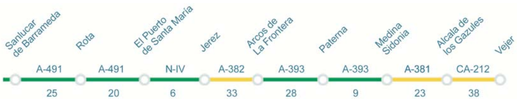
Ruta del Gótico-Mudejar, distancia total: 182km